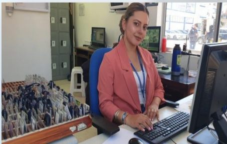
Funcionaria del Hospital Regional de Sogamoso en la ventanilla de fichas para visitas de Hospitalización.

Enmarcados en la Política de Humanización, a través de la cual se fomenta la prestación de los servicios con calidad y calidez y entendiendo las diferentes dinámicas sociales del día a día, directivos del Hospital Regional de Sogamoso, informa a los usuarios que se amplió el espacio de visita a los pacientes hospitalizados : El nuevo horario es de 8 am a 6:30 pm, todos los días y se adopta con el propósito de facilitar el acceso a personas que trabajan o que se desplazan de otros municipios hasta la ciudad de Sogamoso.