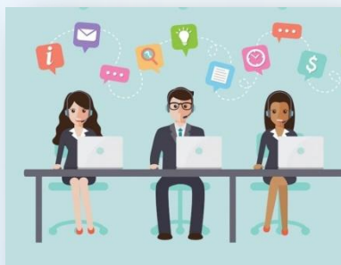
Sistema de recepción de múltiples llamadas a través de una línea telefónica

Directivos del Hospital Regional de Sogamoso, atendiendo las necesidades de la comunidad y haciendo uso de las nuevas tecnologías, trabajan para la puesta en funcionamiento del Call Center o Centro de Llamadas.