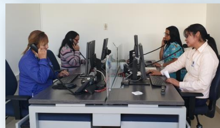
Funcionarias del HRS atendiendo el Call Center

El Call Center es un sistema, atendido por un conjunto de personas, que permite brindar uno o varios servicios solicitados telefónicamente por los clientes; en este caso se busca ampliar el número de personas que contestan las llamadas telefónicas para la asignación de citas médicas, teniendo en cuenta que es uno de las necesidades más sentidas de la comunidad.